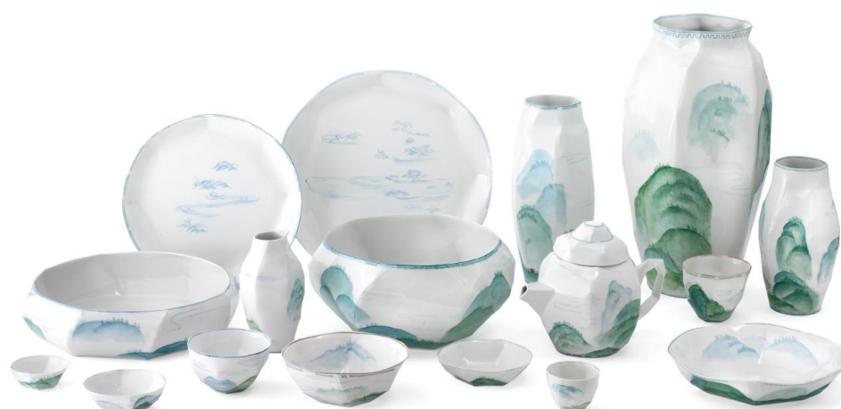
Musée des Tissus, Lyon