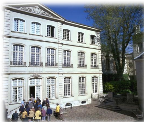
Entrée du musée des Tissus et des Arts Décoratifs.

Le musée des Arts décoratifs fut inauguré, quant à lui, en 1925 dans l'hôtel de Lacroix-Laval, acheté par une Société d'amateurs lyonnais, de souche ou de cœur, dans l'idée de poursuivre cette œuvre d'enseignement universel de l'histoire du goût. En moins de vingt-cinq années, ces amateurs ont doté le musée de collections européennes, orientales, chinoises et japonaises, du Moyen Âge à nos jours. Complété par des acquisitions financées par la Chambre de Commerce, le musée occupe aujourd'hui le rang de deuxième collection française dans le domaine des arts décoratifs. Ces deux musées réunis, après le déménagement du musée des Tissus dans l'actuel hôtel de Villeroy, rue de la Charité, dépendent depuis leur origine de la Chambre de Commerce et d'Industrie de Lyon et tous deux comptent parmi les « musées de France » depuis 2002.