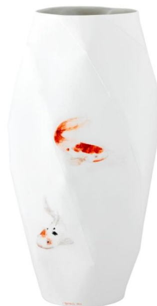
Vase de la série « Etang », Ruth Gurvich pour la manufacture de porcelaine de Nymphenburg, 2012.