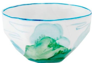
Bol de la série « Lightscape », Ruth Gurvich pour la manufacture de porcelaine de Nymphenburg, 2010.

Mais pour que les artist rooms soient complètes, il fallait qu'elles puissent être tapissées d'un textile et d'un papier peint créés pour l'occasion. C'est l'implication de partenaires excellant dans chacun de ces domaines qui a permis à ce projet d'aboutir par l'écoute mutuelle et les échanges que l'artiste a pu développer avec la manufacture Prelle, à Lyon, et l'atelier d'Offard, à Tours. Au côté des éditions de la manufacture de porcelaine de Nymphenburg – la série EPURE et les vases POISSONS – et de la maison Richard Orfèvrerie – la série CEREMONIA – le tissu LITTORAL de Prelle et le papier peint ISTHME de l'atelier d'Offard permettent l'immersion dans l'univers de Ruth Gurvich où la beauté formelle des œuvres, comme un doux ressac, vient caresser la grève d'une construction plastique extrêmement rigoureuse.