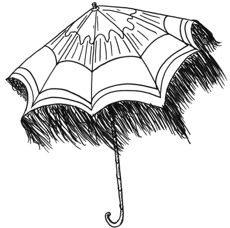
OMBRELLE MÉCANIQUE, Lyon, 1860. MT 2014.2.4.