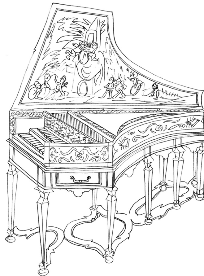
Pierre Donzelague, CLAVECIN À DEUX CLAVIERS , Lyon, 1716. MAD 2697.

MUSEUM DES TISSUS MUSEUM DES TISSUS MUSEUM DES TISSUS