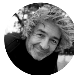
Rudy RICCIOTTI Architecte

Le chantier de restauration de l'hôtel de Lacroix-Laval est la première phase d'un projet de très grande ampleur. Cet ensemble architectural exceptionnel est en cours de restauration par l'agence archipat, en lien avec la conservation régionale des monuments historiques de la Direction régionale des affaires culturelles (DRAC).