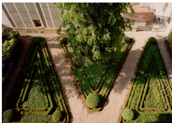
Vue du jardin du musée.