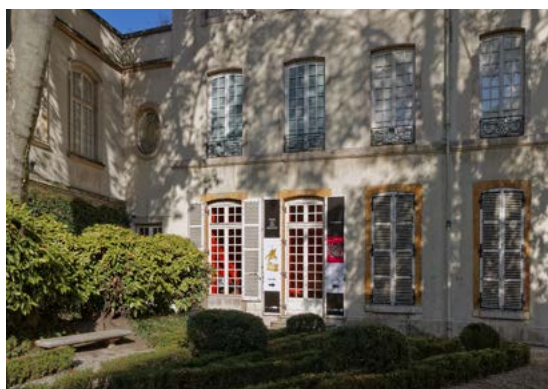
Vue de l'hôtel de Lacroix-Laval.