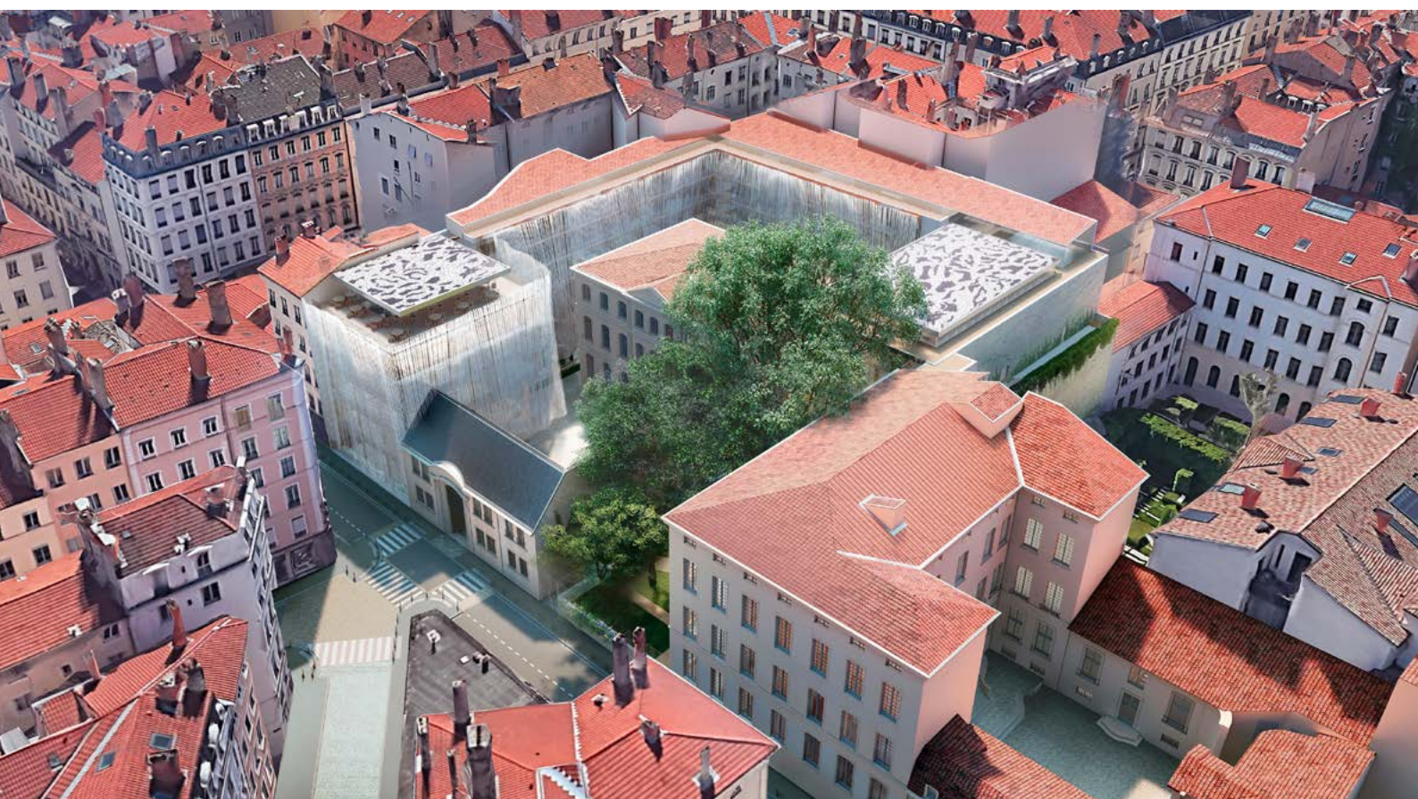
Vue aérienne du musée des Tissus © Agence Rudy Ricciotti