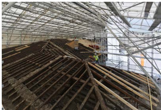
Phase détuilage

À LA RÉOUVERTURE DU MUSÉE DES TISSUS, L'HÔTEL DE LACROIX-LAVAL SERA LE SEUL HÔTEL PARTICULIER XVIII e COMPLET DE LYON OUVERT AU PUBLIC.