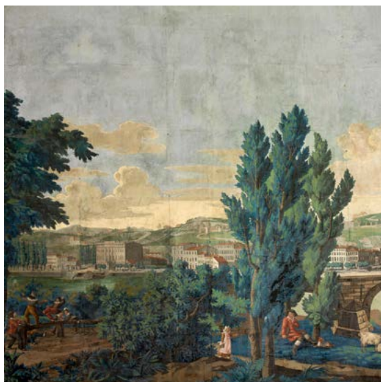
Félix Sauvinet, Vues de Lyon, papier peint. MAD 1328. Acquis de Thiébaud sur les arranges du legs Gonin, 1935.

Une attention particulière sera portée au papier peint « Vues de Lyon » imprimé par Félix Sauvinet à Paris en 1823, sera à cette fin déposé et restauré.