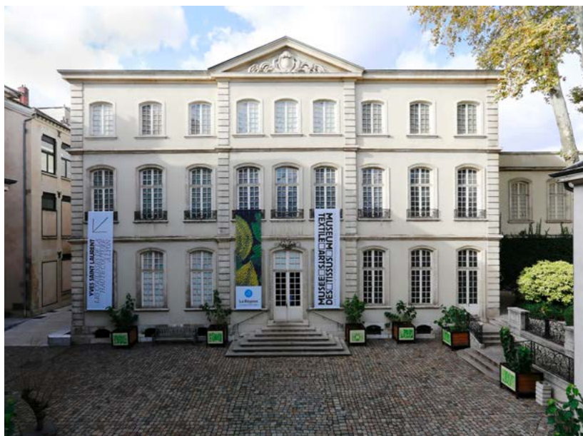
Vue de l'hôtel de Villeroy.

Sur cette base, des travaux sont entrepris dès 2021, pour permettre une restauration du bâtiment dans l'esprit XVIII e et le restituer au plus près de son état d'origine.