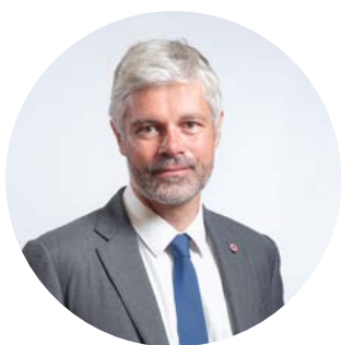
Laurent WAUQUIEZ, Président de la Région Auvergne-Rhône-Alpes